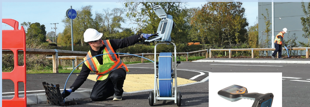
Bobina de fontanería C541c